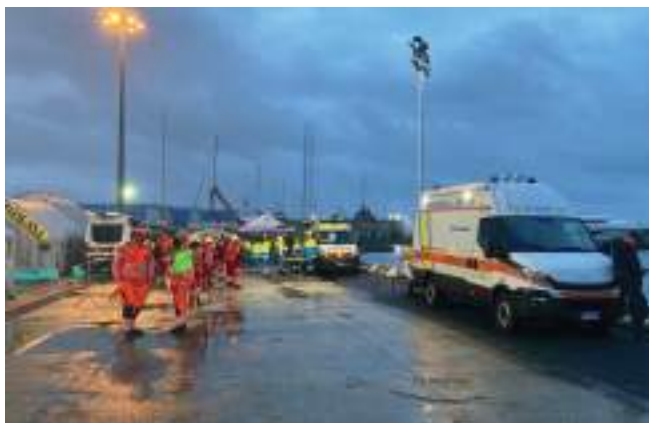
Livorno: il dispositivo di soccorso allestito al Molo 57 per l'emergenza migranti.

Porto con me le parole del comandante della Life Support . Era il suo primo incarico su una nave