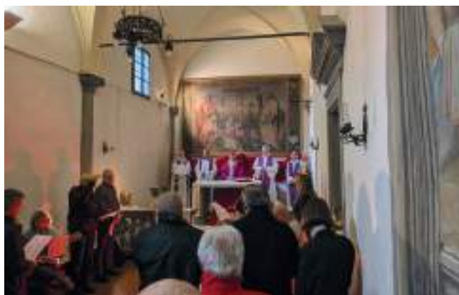
18 dicembre 2025, Messa all'Albergo Popolare di Firenze presieduta da mons. Gherardo Gambelli.

occorre svolgere un lavoro di equipe che può essere in grado di cogliere i bisogni e di costruire percorsi coerenti. Per questo motivo, l'Albergo Popolare lavora in stretto rapporto con gli ospedali, con il pronto soccorso e col sistema specialistico territoriale che si occupa di salute mentale e di dipendenze.