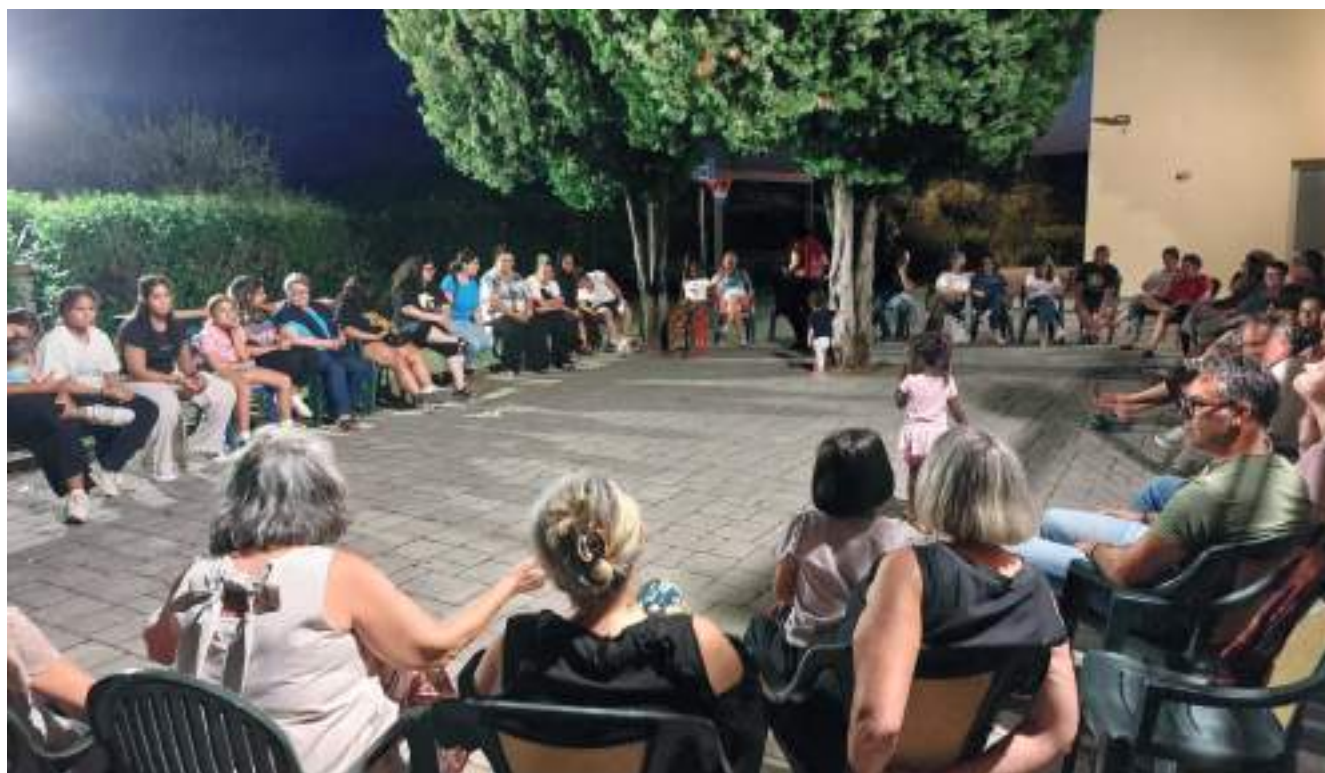
La "Fraternità della Visitazione" di Pian di Scò.

Sono molto felice che tutto questo sia nato con