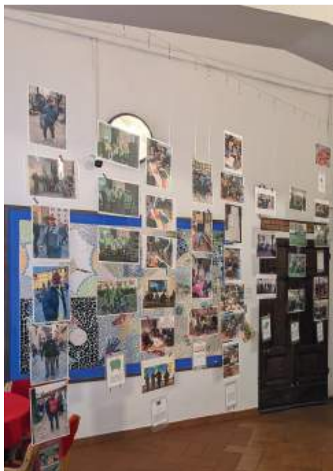
18 dicembre 2025, Albergo Popolare di Firenze.

I volontari si possono iscrivere attraverso il sito "Tutti contano" e, per coloro che aderiscono, è prevista una formazione. Il censimento è molto importante perché, a distanza di oltre 10 anni dall'ultimo, permette di ottenere una fotografia aggiornata del fenomeno delle persone senza dimora, a supporto di chi deve costruire le politiche di intervento e percorsi di inclusione ed integrazione delle persone che vivono in strada ed ai margini della società.