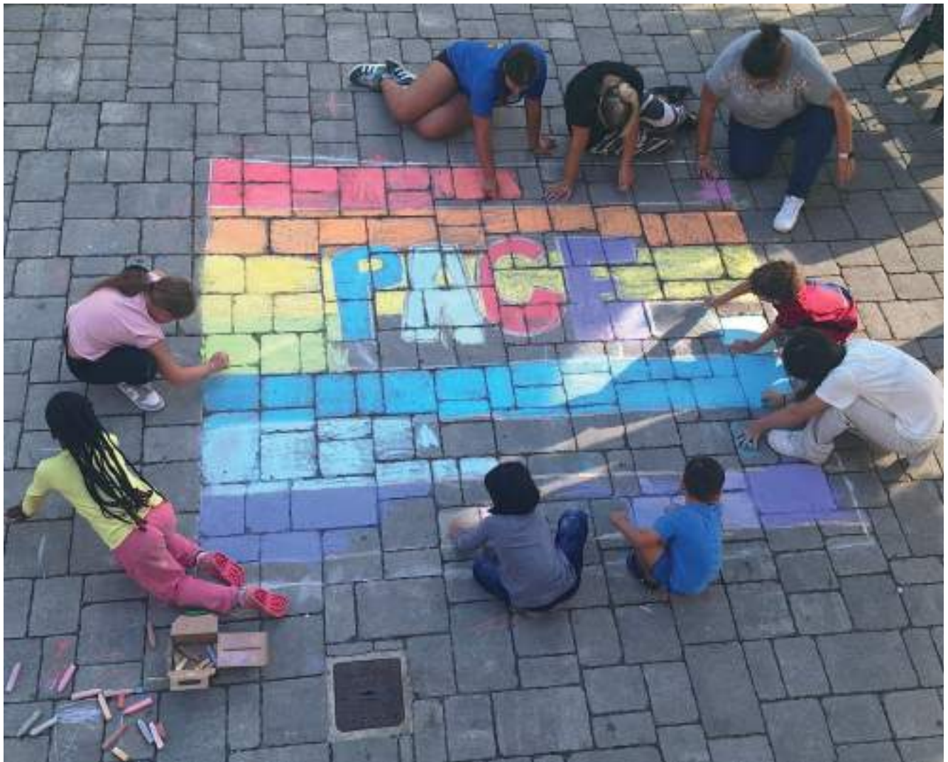
La "Fraternità della Visitazione" di Pian di Scò.

tanta fatica, tanto sacrificio, ma anche tanta bontà da parte delle centinaia di persone che passano di qui. Le donne qui partoriscono, oppure arrivano con bambini piccoli, bambini più grandi, bambini con forme di handicap, oppure bambini che non hanno nulla e hanno semplicemente bisogno di un tetto. Mamme brave che, dopo aver sfogato un po' di rabbia e di crisi, riescono a ripartire e a stare in piedi, perché questa non è una comunità assistenziale, ma è una fraternità che decide di camminare insieme: non perché qualcuno sia nel disagio, ma perché tutti ne abbiamo diritto. Anche noi, come persone e come suore che vivono qui (abbiamo circa venticinque volontari fissi e ultimamente sono arrivati tanti ragazzi che fanno doposcuola e sostegno scolastico), abbiamo il diritto e il desiderio di sentirci parte di un cammino fraterno. Un cammino dove non si va avanti da soli, ma si va avanti perché insieme crediamo in qualcosa.