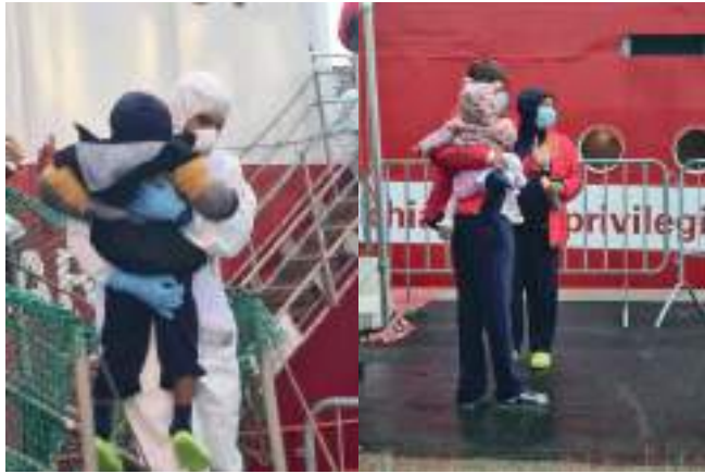
Operazione di accoglienza e supporto umanitario sulla banchina portuale.

legale, ovvero informazioni su ciò che accadrà loro in Italia e sui motivi per cui devono sottoporsi a certe procedure. Questo percorso è attuato insieme ai mediatori linguistici della Croce Rossa, che assistono la Questura e la Prefettura.