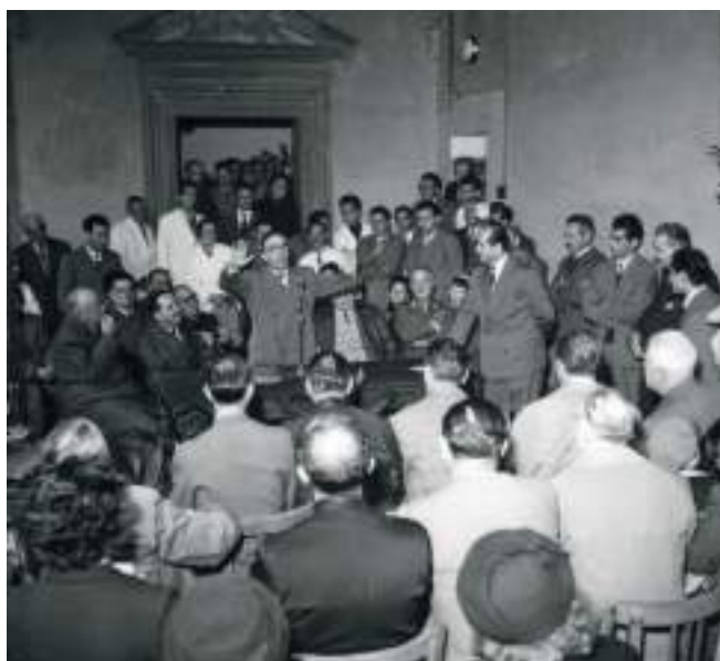
6 novembre 1955 – La Pira alla festa per i 50 anni dell'Albergo Popolare.

Attesa miracolista? Niente affatto: la povera gente è piena di buon senso, ragiona in maniera elementare: è "realista", come si dice: cioè sa ben distinguere fra le cose possibili e le cose impossibili e chiede le une e non le altre!