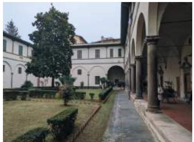
Il chiostro dell'Albergo Popolare di Firenze.

L'esperienza all'Albergo è molto importante sia nella